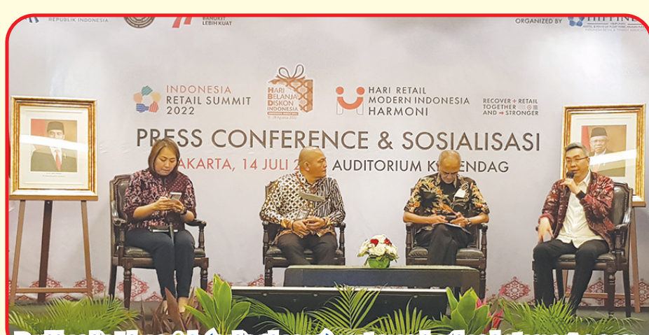
Budiardjo Iduansjah (paling kanan) saat memberikan keterangan pers.

lebih dua tahun belakangan ini, para peretail mengalami penurunan, baik dari segi daya beli, hingga transaksi," ujar Mendag dalam konferensi pers di Auditorium Kementerian Perdagangan, Jakarta, Kamis (14/7) lalu. Mendag berharap event ini menjadi wadah sosialisasi untuk para peretail di Indonesia agar dapat terus berkembang dan menjadikan industri ritel tumbuh secara maksimal, sekaligus mendukung perputaran perekonomian nasional. Deputi Bidang Industri dan Investasi Kementerian Pariwisata dan Ekonomi Kreatif Henky Hotma Parilindungan Manurung menambahkan, Era baru pasca pandemi