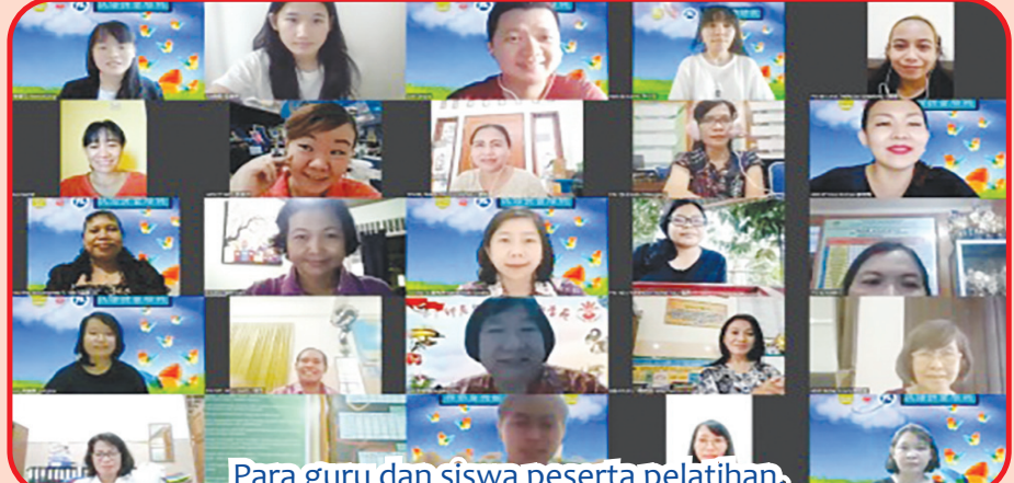
Para guru dan siswa peserta pelatihan.

Juga mendorong guru lokal untuk selalu menjaga kegigihannya dalam belajar dan semangat untuk tidak malu bertanya.