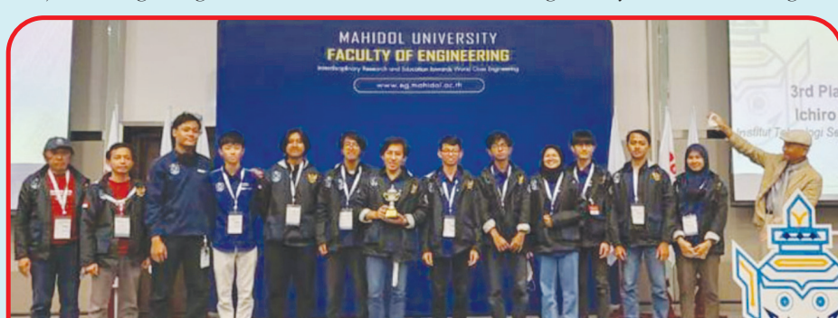
Seremoni pengumuman pemenang dan penyerahan penghargaan juara RoboCup 2022 oleh Federasi RoboCup.