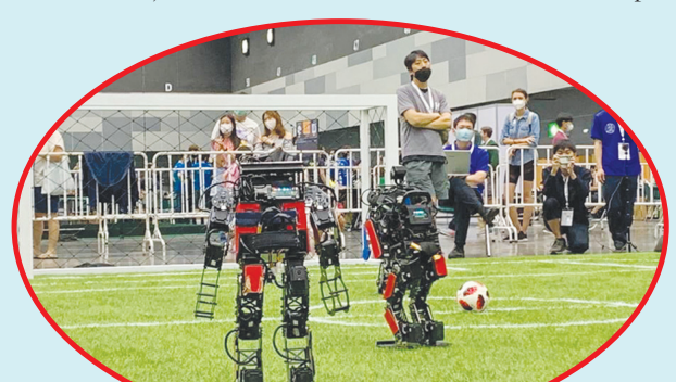
Robot humanoid tim Ichiro ITS saat bertanding di RoboCup 2022.

tahunan yang diselenggarakan oleh Federasi RoboCup, sebuah federasi internasional yang berisikan para peneliti bidang robotika dan AI. Setiap tahun, RoboCup terselenggara di beberapa negara yang berbeda, dan diikuti oleh ratusan tim dari seluruh dunia dalam 19 kategori lomba robot. Pada kompetisi terakhir, tercatat setidaknya terdapat 335 tim yang berasal dari 40 negara berpartisipasi, dengan total pengunjung hingga 2.200 orang. • anto tze