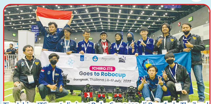
Tim Ichiro ITS saat di ajang RoboCup 2022 di Bangkok, Thailand.