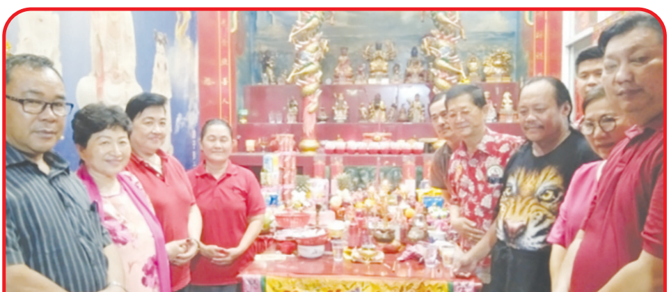
Pimpinan dan pengurus TITD Giok Ong Tian Co berfoto bersama dalam Perayaan HUT Dewi Kwan Im di TITD Mulia Sejati.

RIAU (IM) - Ratusan umat menghadiri Hari Ulang Tahun (HUT) Dewi Kwan Im di TITD (Tempat Ibadah Tri Dharma) Mulia Sejati Jalan Lokomotif Perumahan Jondul