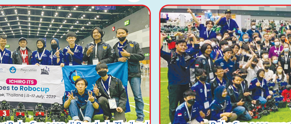
RoboCup 2022 yang diikuti peserta dari berbagai negara.

kompetisi Humanoid Soccer Kid Size, Tim Ichiro ITS menerjunkan empat robot humanoid dengan dua ukuran yang berbeda. Yang memiliki total 20 sendi, sert sensor manusia berupa lima pancaindra. "Kami juga menerapkan algoritma berbasis kecerdasan buatan (AI), menggunakan deep learning," tambah dosen Departemen Teknik Komputer tersebut. Sementara kategori Middle Size League yang diikuti oleh tim IRIS ITS, menampilkan