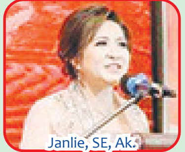
Janlie, SE, Ak.