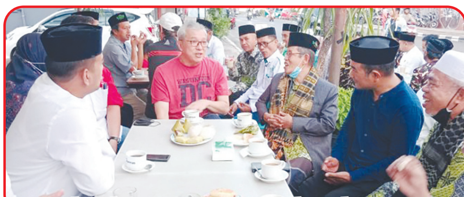
Suasana silaturahmi antara PC NU Kota Makassar bersama Pengurus Perhimpunan INTI Sulsel.

MAKASSAR (IM) - PC NU (Pengurus Cabang Nahdlatul Ulama) Kota Makassar bersama Pengurus Perhimpunan INTI (Indonesia Tionghoa) Sulawesi Selatan bersilaturahmi dalam Ngopi Nusantara di Warkop Tong San, Jalan Pasar Ikan, Kota Makassar, Minggu (17/7). Kegiatan Ngopi Nusantara merupakan rangkaian Muskercab (Musyawarah Kerja Cabang) II PCNU Kota Makassar bertema "Jagai Makassar Ta" yang digelar Sabtu dan Minggu 16-17 Juni lalu di Makassar Golden Hotel. Ngopi Nusantara ini dilaksanakan usai salat subuh berjamaah dan halaqah Aswaja di salah satu masjid yang ada di Jln Somba Opu, Kota Makassar.