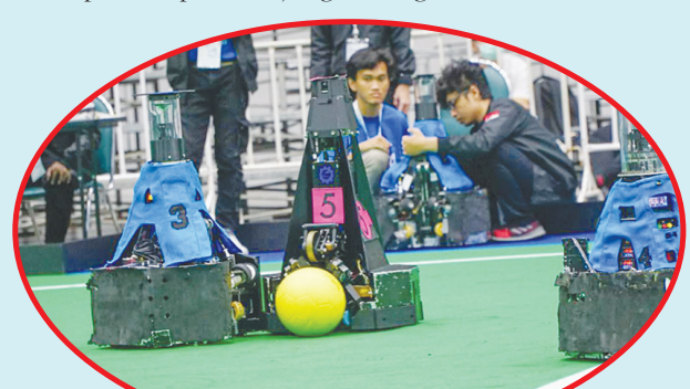
Robot beroda milik tim IRIS ITS saat berlaga pada ajang RoboCup 2022.