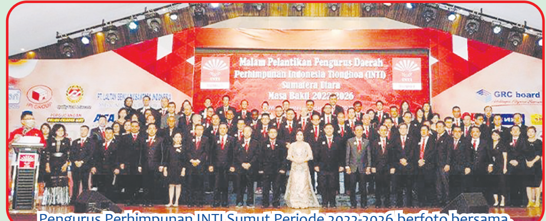
Pengurus Perhimpunan INTI Sumut Periode 2022-2026 berfoto bersama.