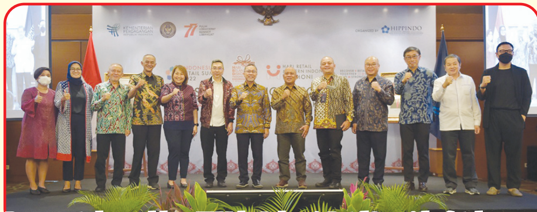
Para peserta dan pendukung HBDI dan Indonesia Retail Summit berfoto bersama.

JAKARTA (IM) - Hippiindo (Himpunan Peritel dan Penyewa Pusat Perbelanjaan Indonesia), menghadirkan program tahunan baru, Indonesia Retail Summit, yang akan berlangsung selama dua hari, mulai 15 Agustus 2022 di Lantai 4 dan 5 Gedung Sarinah, Thamrin, Jakarta Pusat, bertepatan dengan momentum perayaan Hari Jadi Sarinah. Selain itu dilaksanakan HBDI (Hari Belanja Diskon Indonesia) 2022 dan Harmoni (Hari Retail Modern Indonesia) 2022. Menteri Perdagangan Zulkifli Hasan menyampaikan apresiasinya terhadap komitmen Hippiindo melalui Indonesia Retail Summit 2022. "Industri ritel sempat terdampak selama kurang